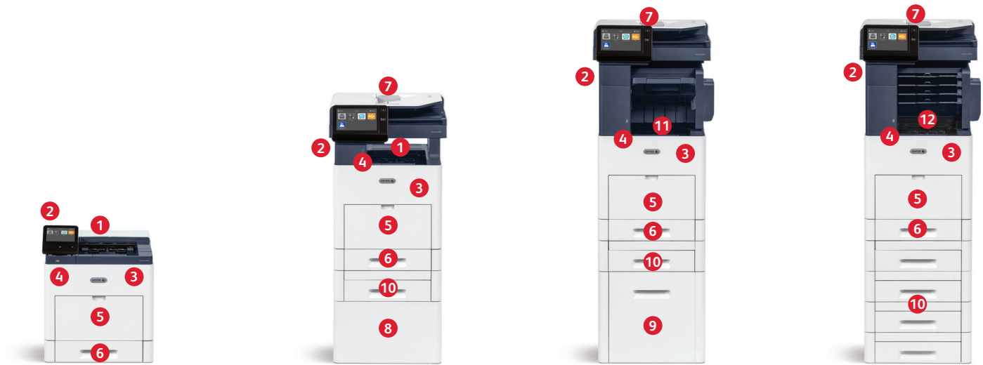
Impresora de color Xerox® VersaLink® C600 Imprime. Conectividad móvil.